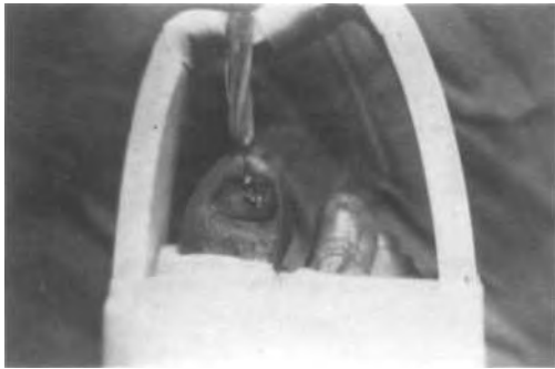
Fig. 3. Tracción continua

b) Osteotomía del primer metatarsiano. El resultado estético es mucho mejor, así como el funcional, pero representa una mayor agresión para el enfermo y nos alarga el período de recuperación.