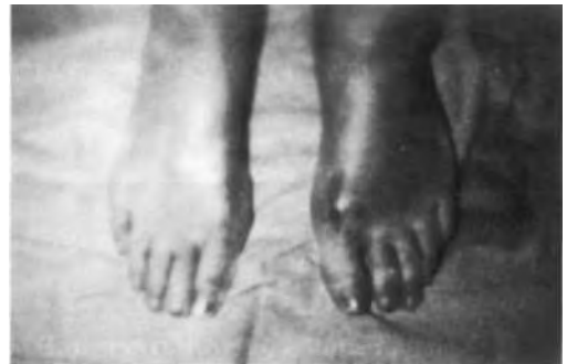
Fig. 2. Postoperatorio.

El problema se presenta por tratarse habitualmente de personas de cierta edad. Interesa hacer poco daño al paciente de forma que la relación éxito-agresión sea lo más favorable posible.