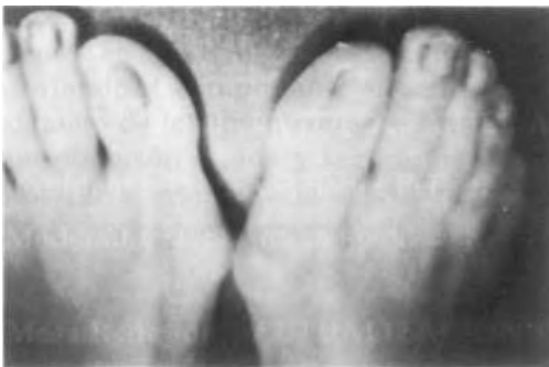
Fig. 1. Hallux Valgus preoperatorio.

Al hablar del tratamiento del Hallux Valgus es prácticamente imposible resumir. Cada cirujano tiene su método, y al ojear el Clinical Orthopaedics se contabilizan unos 70, y aún se quedan cortos. Por ello nos limitaremos a exponer de una manera concisa y breve lo que hacemos en el Hospital del Sagrado Corazón. Por debajo de los 40 años practicamos la capsulectomía amplia y sección de la musculatura valguizante. Por encima de los 40 años, la operación de BRANDES. En casos dudosos la elección de uno y otro método dependerá del grado de artrosis existente.