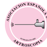
Imagen de portada