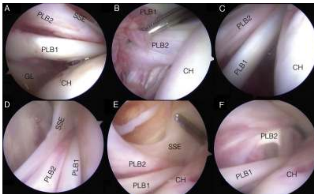
Figura 3 – Secuencia fotográfica de artroscopia de hombro derecho. Paciente en decúbito lateral, vista a través de óptica de 30° en portal posterior. En recuadro A se observa la porción larga del bíceps en su origen en el tubérculosupraglenoideo (PLB1), por sobre ella las fibras accesorias provenientes del tendón del músculo supraespinoso (SSE), que son el origen de la PLB accesoria duplicada (PLB2), además de la glena (GL) y la cabeza humeral (CH). En recuadro B se puede observar desde la misma visión la PLB1 elevada con instrumental, mostrando la salida de estas fibras accesorias del SSE que dan origen a la PLB2. EL recuadro C muestra el ascenso de la visión acompañando las fibras de la PLB2 provenientes del SSE que discurren por sobre la PLB1. Los recuadros C y D muestran cómo la PLB2 accesoria discurre entre elSSE y la PLB1 hacia la corredera bicipital, así como también el «foot print» del SSE en la CH. El recuadro E presenta la PLB2 traccionada y elevada por instrumental, observando de mejor manera las fibras originales del SSE y la conformación de la PLB2 que ingresa a la corredera junto a la PLB1.

tendinopatía de la PLB y la visión artroscópica mostró conflicto de espacio en la corredera, se realizó una tenotomía de la porción aberrante a nivel de la corredera y tenodesis anatómica suprapectoral de la otra porción con tornillo interferencial de 8 mm y túnel de 9 mm. Posteriormente, se realizó una reparación del manguito, con 3 anclajes bioabsorbibles, 4 puntos simples y en doble fila, previa cruentación de la huella de inserción con nanofracturas. El paciente inicia, según protocolo, movimientos activos de codo, muñeca y mano de inmediato, además de pasivos asistidos desde la semana. En los controles posquirúrgicos que son: el primero a la semana poscirugía y luego mensual, el paciente presenta ausencia de dolor y pruebas negativas para PLB, así como recuperación adecuada en relación con la reparación del manguito rotador.