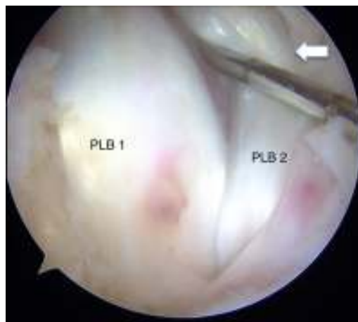
Figura 2 – Visión de la corredera bicipital desde el espacio subacromial por portal lateral con óptica de 30° donde se aprecian las 2 bandas de la PLB (PLB1 y PLB2) en la corredera bicipital, con signos macroscópicos de sufrimiento por compromiso de espacio (flecha).

El paciente fue colocado en decúbito lateral e intervenido con anestesia general más plexo interescalénico. La visualización artroscópica confirmó una rotura completa del supraespinoso y parcial mínima del subescapular, con una PLB aberrante duplicada anómalamente en la corredera bicipital (fig. 2), siendo el tendón del supraespinoso el lugar de origen de un fascículo accesorio de menor tamaño (fig. 3a) que se introdujo en la corredera bicipital junto a la PLB nacida del tubérculo supraglenoideo (fig. 3b), generando un conflicto de espacio sintomático, evidenciado macroscópicamente en desestructuración parcial en la superficie de ambos fascículos en su confluencia (fig. 3a). Como el paciente presentaba en su examen físico prequirúrgico clínica compatible con