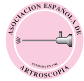
Imagen de portada