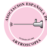
Imagen de portada