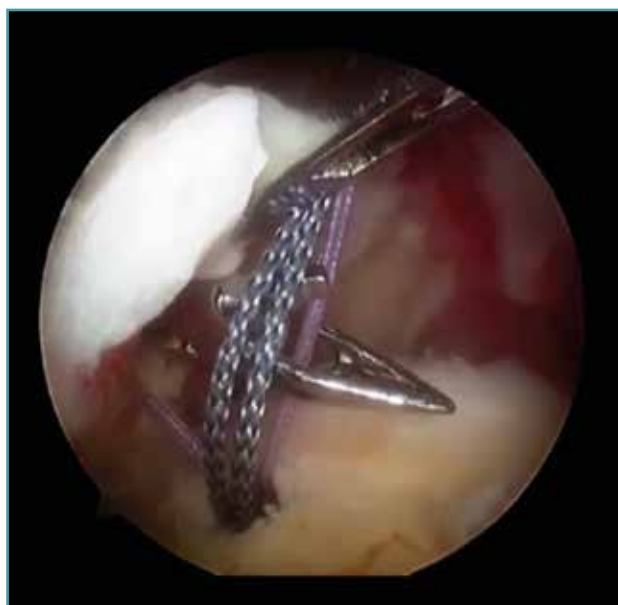
Figura 3. Revisión de una rotura de manguito rotador.

Se han definido unos factores que modifican la composición del PRP: edad, sexo, actividad física, dieta, fármacos y comorbilidad. Igualmente, un mismo PRP puede producir diferentes respuestas