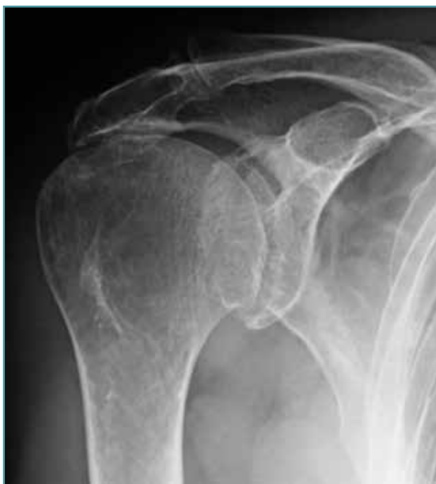
Figura 1. Subluxación fija de la cabeza humeral (distancia acromiohumeral < 7 mm).