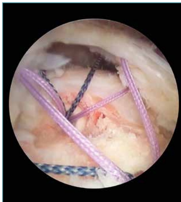
Figura 2. Rotura masiva delaminada de supraespinoso e infraespinoso.

Así pues y de cara a optimizar el resultado funcional de nuestras reparaciones, las preguntas que nos deberemos formular son: ¿qué roturas no se deben reparar?, ¿qué roturas masivas se deben reparar? y ¿qué roturas masivas se pueden reparar?