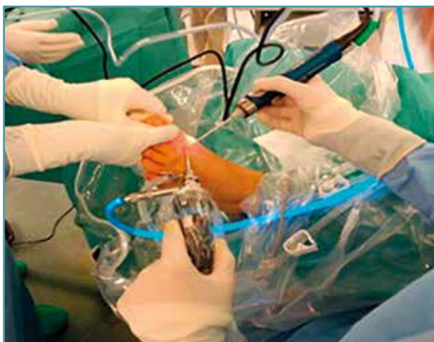
Figura 2. Portales dorsomedial y dorsolateral. Artroscopia de primera articulación metatarsofalángica.

extraemos (Figura 3). Se practica una sinovectomía y cauterización de la cápsula articular y se producen microperforaciones con una aguja K de 1 mm en el defecto condral superolateral de la cabeza del hallux . Tras una limpieza exhaustiva de la articulación con infusión y aspiración de suero fisiológico, se cierran los 2 portales con puntos de nailon. El rango de movilidad tras la extracción del cuerpo libre y bajo anestesia es completo.