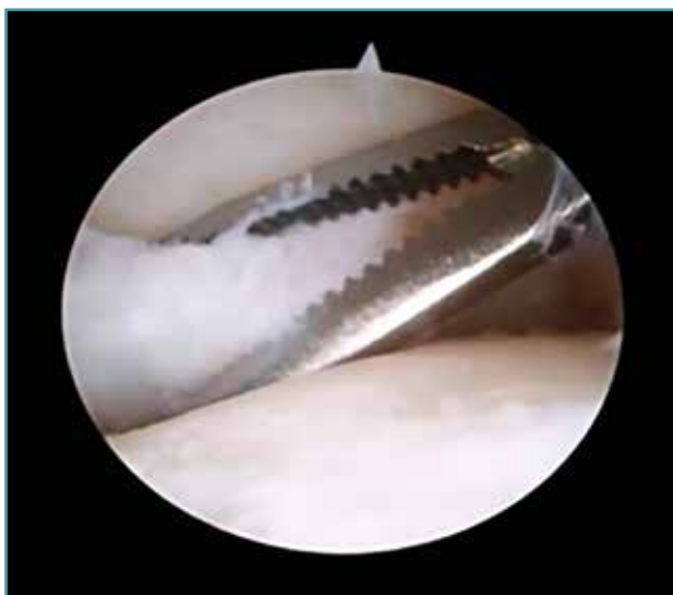
Figura 3. Extracción de cuerpo libre osteocondral de la primera articulación metatarsofalángica.

El paciente recibe el alta médica el mismo día de la intervención sin ninguna complicación a destacar. Se inmoviliza con un vendaje compre-