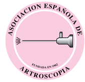
Imagen de portada