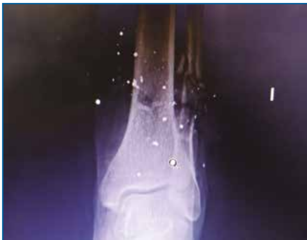
Figura 2. Radiografía tomada en urgencias. Se aprecia fractura del tercio distal del peroné con conminación ósea.