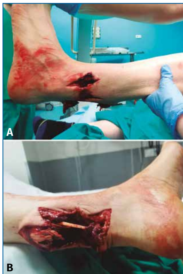
Figura 1. Fotografías tomadas en urgencias. Se aprecian orificios de entrada y salida del arma. Lesión con importante déficit cutáneo y de partes blandas. Flujo distal conservado.

Se trata de un paciente varón de 49 años que presentaba una fractura abierta de peroné de tipo IIIB de Gustilo y Anderson tras sufrir un accidente por arma de fuego. Se observa defecto cutáneo de unos 10 cm en la región posterior de la pierna izquierda ( Figuras 1A y 1B ). En la radiografía se aprecia una fractura del tercio distal del peroné sin afectar a más estructuras óseas ( Figura 2 ).