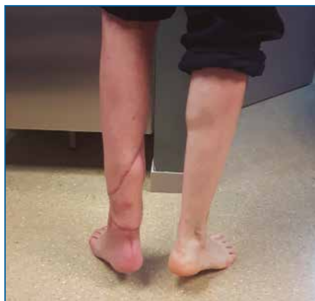
Figura 7. Fotografía tomada en consulta. A los 5 meses de la intervención, el paciente puede ponerse de puntillas. Tiene 30° de flexión plantar activa.

muñón distal suficiente (Figura 5). De forma simultánea, se realizó la cobertura cutánea con un colgajo fascio-cutáneo vascularizado del muslo del paciente (Figuras 6A, 6B y 6C).