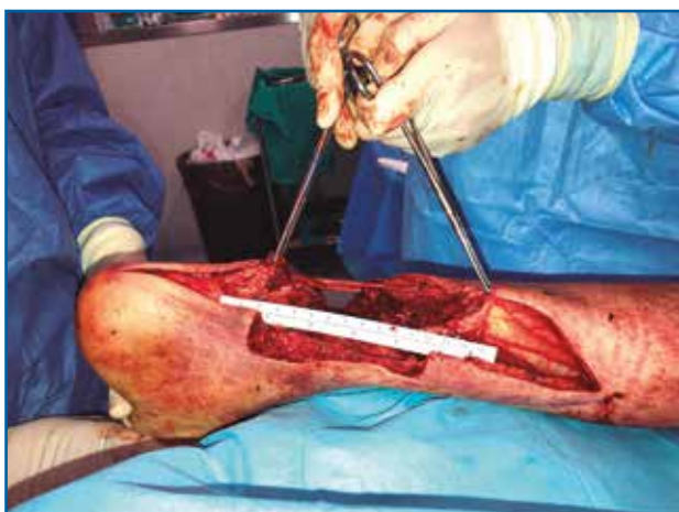
Figura 3. Fotografía intraoperatoria. Tras desbridamiento, se objetiva gap de unos 15 cm.

El paciente fue trasladado posteriormente a la planta de hospitalización para un tratamiento definitivo de forma programada y multidisciplinar.