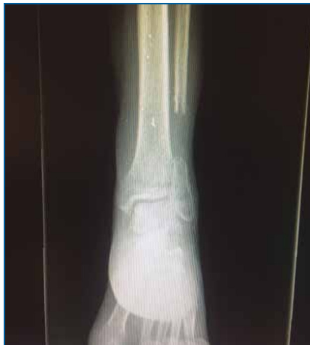
Figura 4. Radiografía tomada 5 meses después, tras el tratamiento conservador.