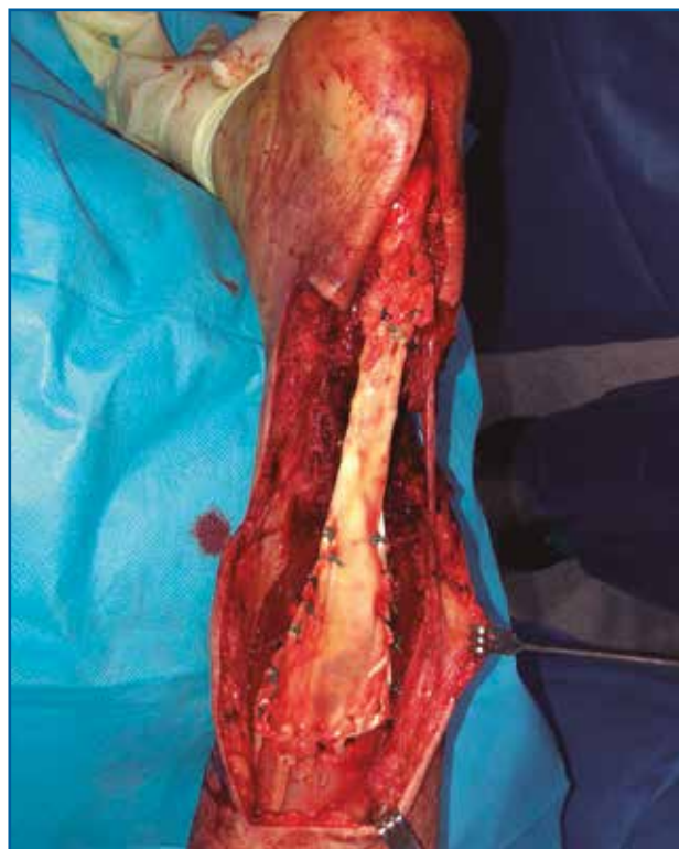
Figura 5. Fotografía intraoperatoria. Muestra la sutura proximal de tipo Krackow y la anastomosis distal con muñón de tendón remanente.

El aloinjerto fue procesado en nuestro banco de tejidos. Tras el procesado, se sumergió en una