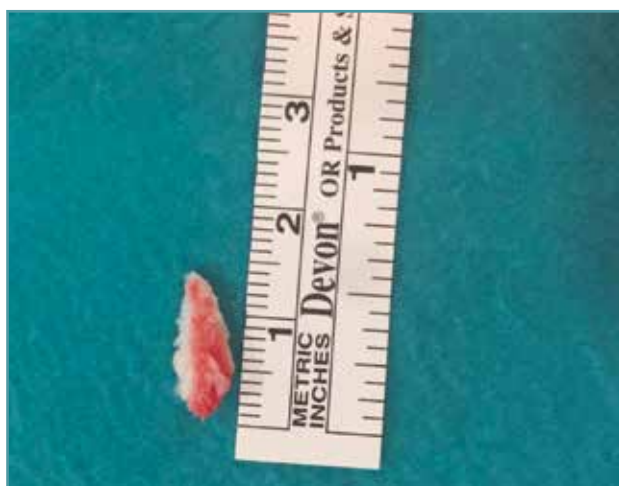
Figura 2. Fragmento óseo intraarticular extraído mediante artroscopia.

dera dentro de las 6 primeras horas posteriores a la luxación. La reducción fue satisfactoria, pero la TC muestra la presencia de fragmentos intraarticulares ( Figura 1 ). Se le realizó tratamiento artroscópico de cadera con extracción de fragmentos ( Figura 2 ).