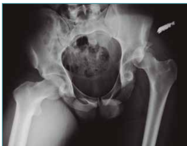
Figura 3. Radiografía anteroposterior de pelvis donde se muestra la luxación posterior de la cadera izquierda.

Se trata de un varón de 57 años que sufre luxación posterior de cadera izquierda con fractura conminuta de la ceja posterior del acetábulo tras un accidente de tráfico ( Figura 3 ). Se trata mediante reducción cerrada de cadera dentro de