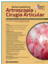
Imagen de portada