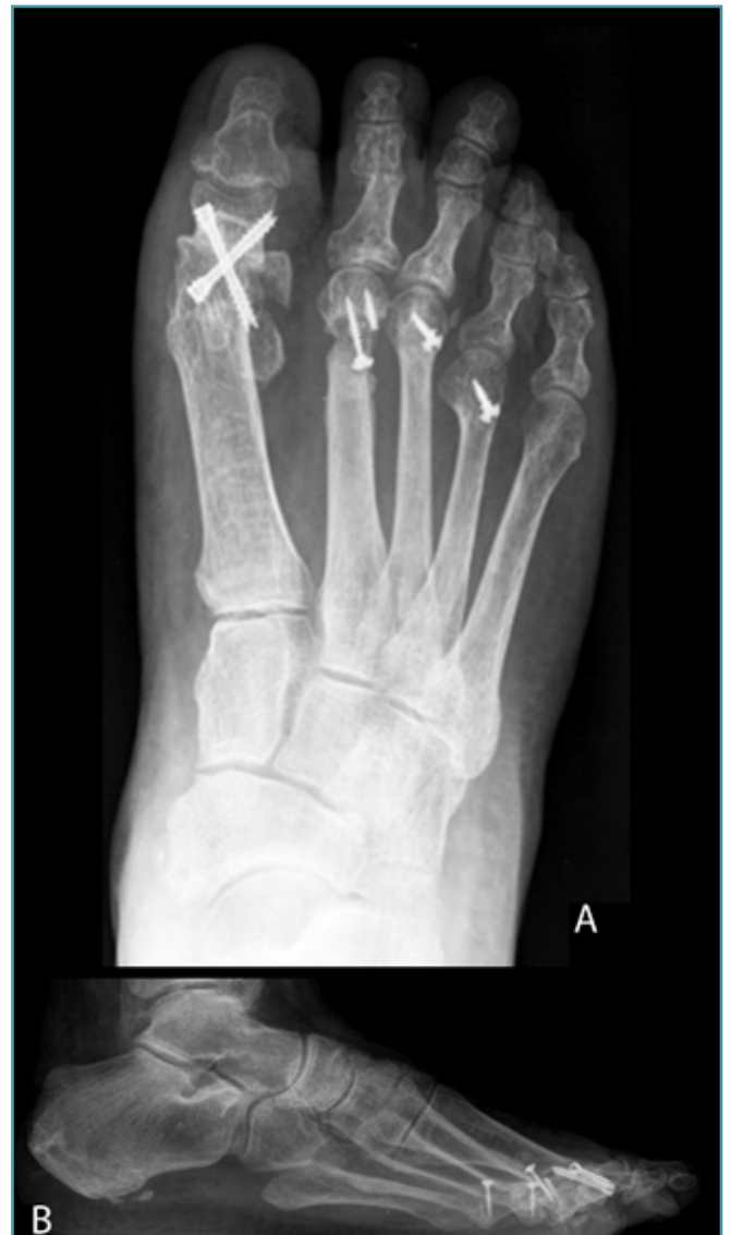
Figura 5. Radiografías posquirúrgicas: A: anteroposterior; B: lateral.

En múltiples ocasiones, y debido a que corresponden a cirugías de revisión, nos enfrentamos a la dificultad