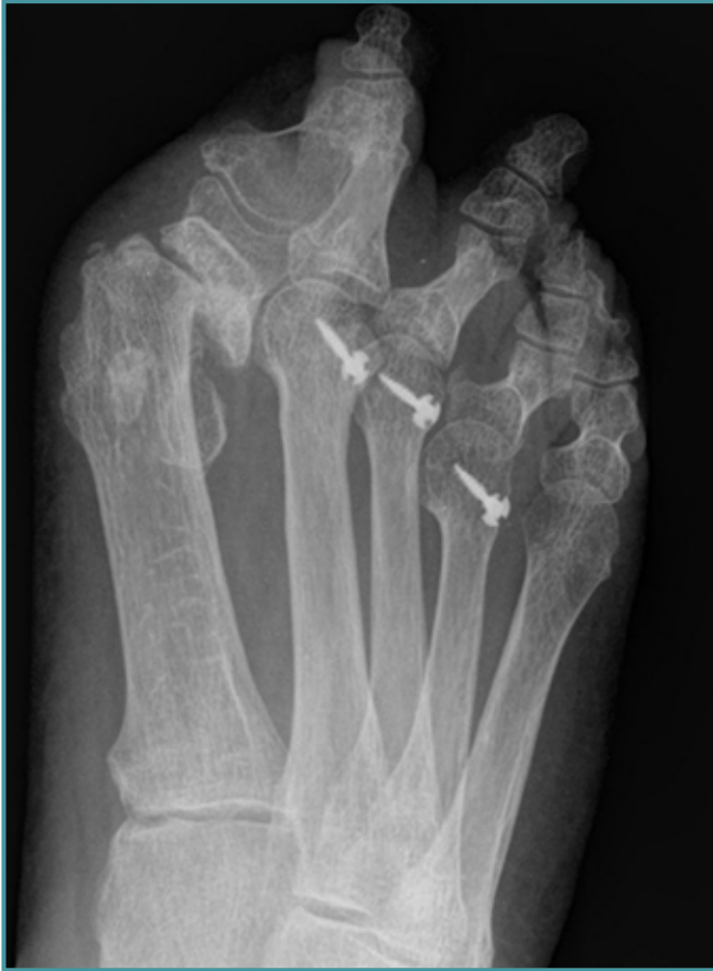
Figura 1. Radiografía anteroposterior preoperatoria.

Figure 1. Anteroposterior preoperative radiograph.