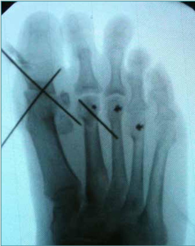
Figura 4. Radioscopia intraoperatoria con la fijación temporal con aguja de Kirschner.

Figure 4. Intraoperative fluoroscopy with the temporary fixation with Kirschner wire.