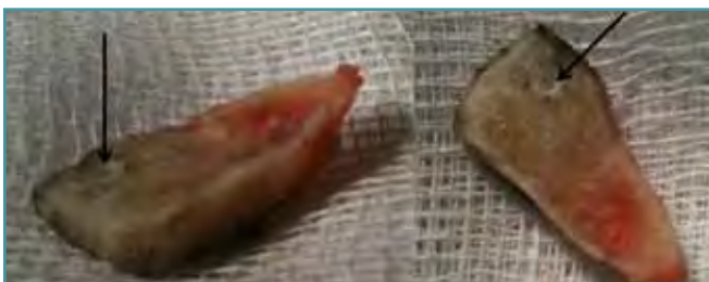
Figura 3. Dos imágenes del bloque óseo removido con el trozo de tornillo en él (marcado con flecha).

Figure 2. Diagram of the two proposals for cutting the triple Weil reosteotomy with nonremovable screw: Alternative A: Make the first cut (through the screw) and the third cut. Alternative B: make the three classic cuts of the triple Weil: the first cut through the screw, the second cut including in the dorsal fragment part of the screw, and the third cut, parallel to the first one, removing a piece of the bone.