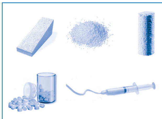
Figura 2. Posibles preparaciones de sustitutos óseos.

La disponibilidad de un número creciente de sustitutos óseos puede parecer atractiva. Sin embargo, sin un conocimiento suficiente de sus propiedades y comportamiento, cada vez será más complicado seleccionar el producto adecuado en cada caso (1) .