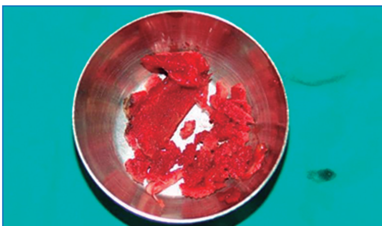
Figura 2. Injerto esponjoso obtenido de cresta iliaca.

jerto autólogo debido a su facilidad de acceso y a la cantidad sustancial de hueso (desde 13 cm 2 de la cresta anterior a 30 cm 2 de la posterior) que es posible obtener, en comparación con otras localizaciones.